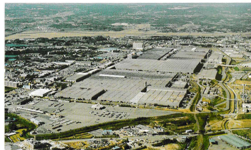
元町工場 Motomachi Plant 工場●機械・プレス・ボデー・塗装・組立工場 生産品目●乗用車 (クラウン・マークII・チェイサー) Shops = Machine, Stamping, Body, Painting, Assembly Products = Passenger Cars (Crown, Cressida, Chaser)