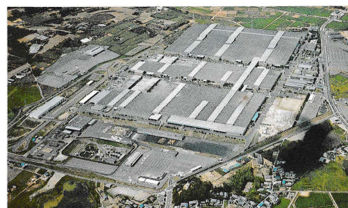
高岡工場 Takaka Plant 工場●プレス・ボデー・塗装・組立工場 生産品目●乗用車 (カローラ・スプリンター) Shops = Stamping, Body, Painting, Assembly Products = Passenger Cars (Corolla, Sprinter)