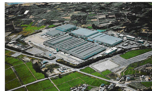
明知工場 Myochi Plant 工場●鋳物工場 生産品目●足まわり系鋳物部品 Shop = Casting Products = Castings