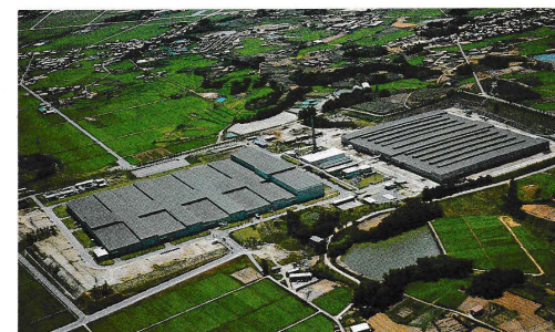
下山工場 Shimoyama Plant 工場●機械工場 生産品目●エンジン部品・排気ガス対策部品 Shops = Machine Products = Engine Parts, Exhaust Emission Control Devices