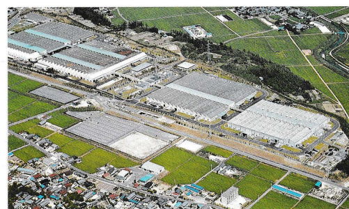
三好工場 Miyoshi Plant 工場●機械工場 生産品目●足まわり・小物部品 Shop = Machine Products = Chassis Parts