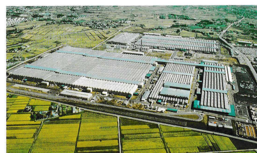
堤工場 Tsutsumi Plant 工場●アルミ鋳物・機械・プレス・ボデー・塗装・組立工場 生産品目●乗用車 (コロナ・カリナ・セリカ) Shops = Aluminium Die Casting, Machine, Stamping, Body, Painting, Assembly Products = Passenger Cars (Corona, Carina, Celica)