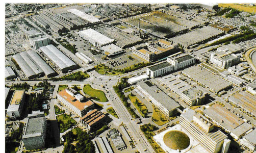
本社および本社工場 Head Office and Honsha Plant 工場●鍛造・機械・プレス・ボデー・塗装・組立工場 生産品目●各種トラック・住宅 Shops = Forging, Machine, Stamping, Body, Painting, Assembly Products = Trucks, Toyota Home