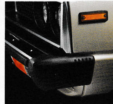
大型バンパー バンパーとしての本質機能をそなえた安全性にすぐれたものが全車に装備。