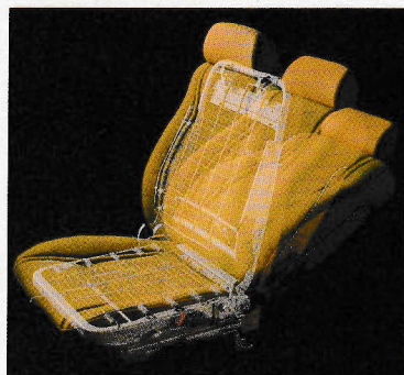
これがTIのシート 装備品のひとつひとつが磨きぬかれたシート設計が自慢です。