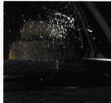
扇状に噴射するウォッシャー ワイパーはもちろんセミコンシールドタイプです。(Lタイプ以上)