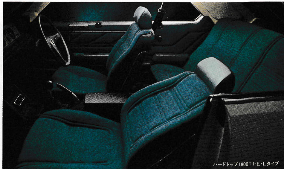
ハードトップ1800TI-E・Lタイプ

初めて乗ったときに感じられる一体感 まるで運転がうまくなったと錯覚する安心感 スカイラインTIはその両方が味わえます。