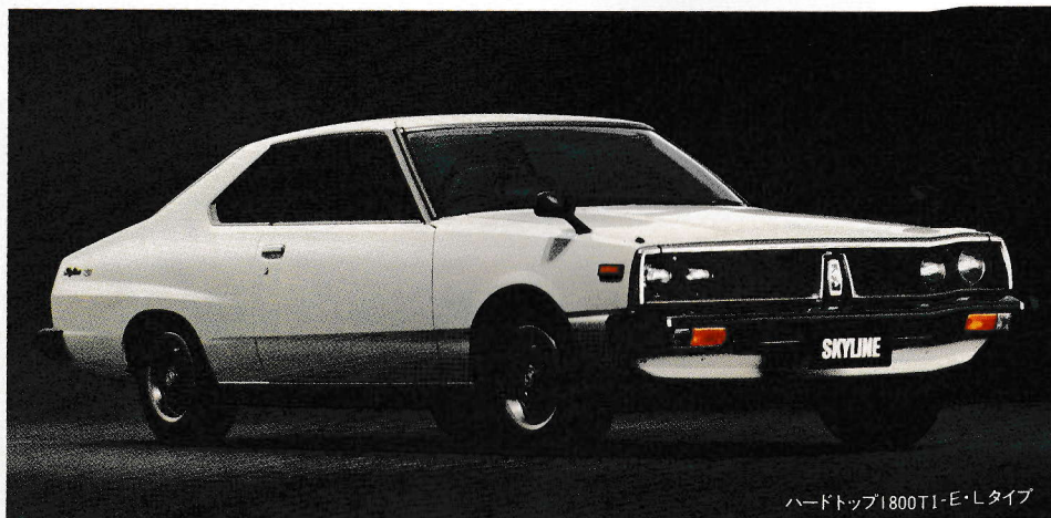
ハードトップ1800TI-E・Lタイプ

初めて乗ったときに感じられる一体感 まるで運転がうまくなったと錯覚する安心感 スカイラインTIはその両方が味わえます。