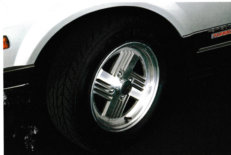
POTENZA RE86M (215/60R15 90H)